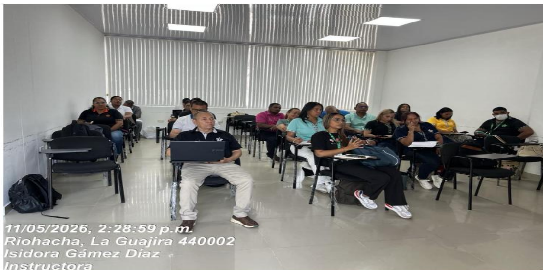
Ilustración 8: Evidencia de reunión programada para el 11 de mayo del 2026 a reunión de seguimiento y orientación de la ejecución contractual

Gestión: Se participio de la reunión programada para el 11 de mayo del 2026 a reunión de seguimiento y orientación de la ejecución contractual.