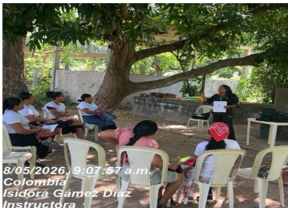
Ilustración 1: Orientación y acompañamiento permanente a los aprendices que se están vinculando al Técnico en Cocina Competencia de Generar Hábitos Saludables De Vida Mediante La Aplicación De Programas De Actividad Física En Los Contextos Productivos Y Sociales

Nota. Registro fotográfico estableciendo horarios con los aprendices del Programa de CampeSENA.