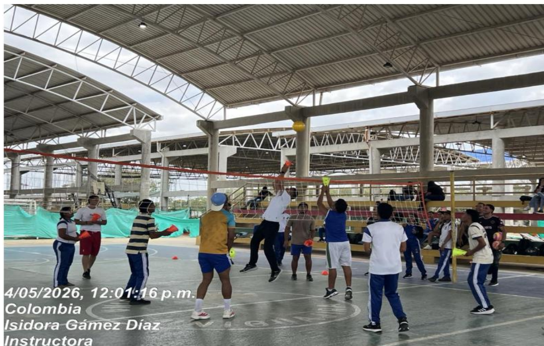
Ilustración 2: Actividad de calentamiento identificar las fortalezas, conocimientos previos y preferencias de aprendizaje de los aprendices, con el fin de adapta las metodologías de trabajo a sus necesidades.

Nota. Registro fotográfico de las actividades de los aprendices inscritos en el complementario de Hábitos y estilos de vida