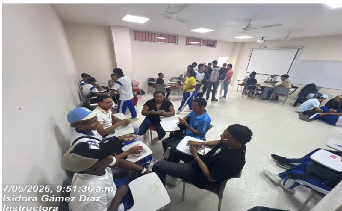
Ilustración 3: acompañamiento la población campesina, realizando diferentes actividades físicas e ideando ideas para mejorar la producción en el núcleo familiar.

Nota: Registro fotográfico de los aprendices de CampeSENA planeando actividades de mejora para aplicar al contexto productivo.